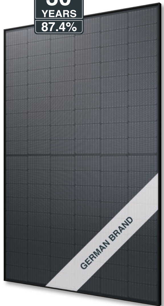
Abb. ähnlich 108TFMDE231213A