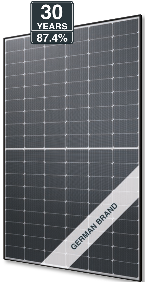
Abb. ähnlich 108TFMDE231004A-56/1